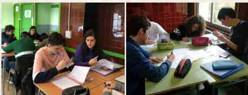
Alumnat de tercer i quart d'ESO treballant cooperativament.

Tot l'equip de professorat hem començat formant-nos i aplicant els coneixements apresos a les aules mitjançant algunes de les tècniques senzilles.