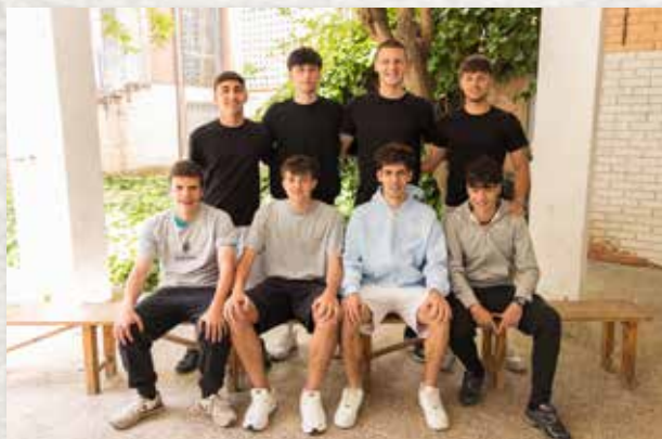
Ensenyaments esportius de Futbol