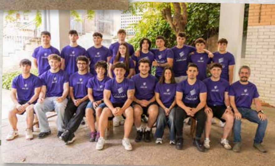
CFGS de Condicionament físic