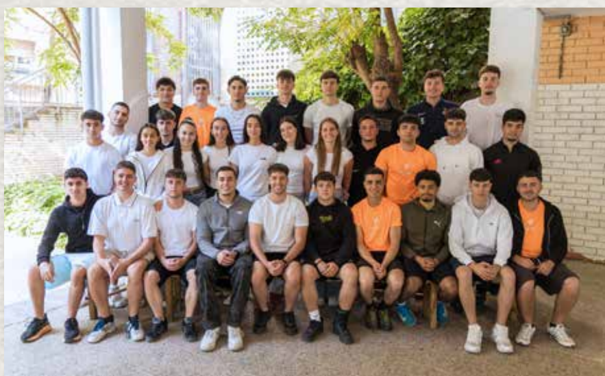
CFGS d'Ensenyament i animació socioesportiva