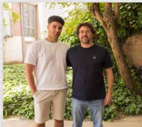
Doble titulació de Batxillerat i Ensenyaments esportius